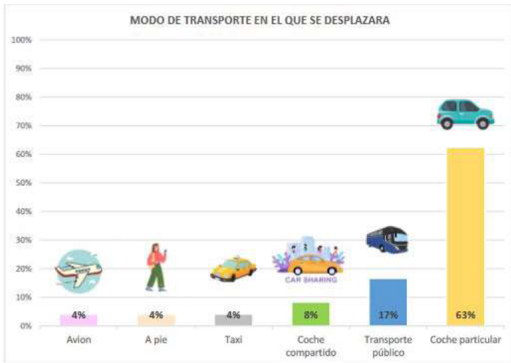
Gráfico 47. Modo de transporte en el que se desplazaran.

Este gráfico refleja el bajo porcentaje de usuarios del taxi, debido, sobre todo, a la falta de oferta y al deficiente servicio ofrecido.